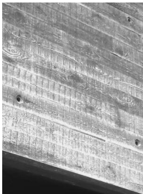
אהל יזכר יד לחללי דקר