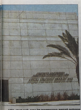
הקולוסטר הנודסה באוניברסיטת תל אביב, לואי קארן, 1974