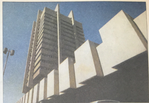
ביתן אודן בימית, שמואל אהרן רוזוב, 1975