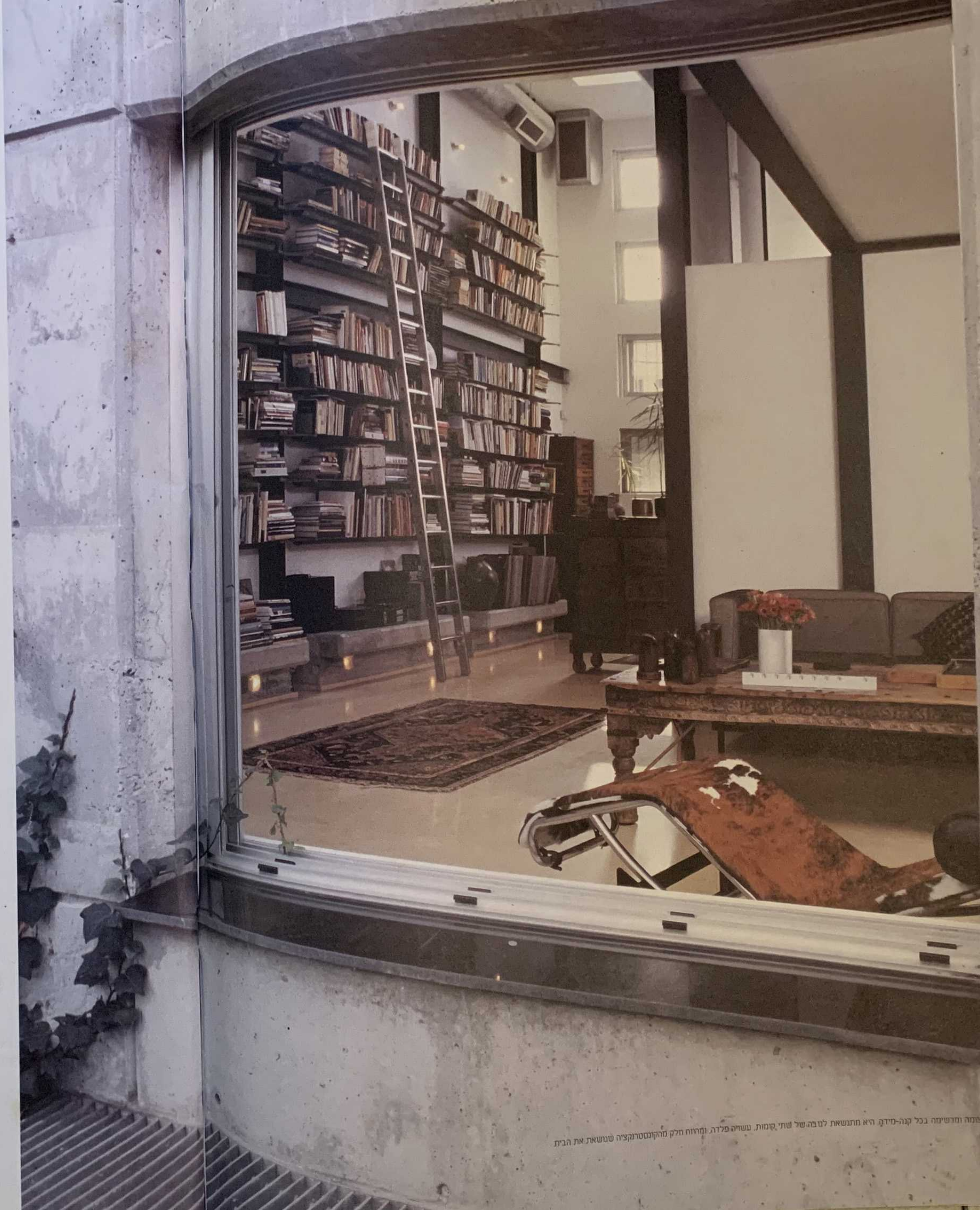
הסטייל: עננתה ומרשימה בכל קנה-מידה. היא מתגשאת לנו בה של שתי קומות. עשויה פלדה, ומרווח הלק מהקונסטרוקציה שנושאת את הבית.

"למה לא? נדא כף. ההיגיון התכנוני של הבתים הגדולים באירופה של פעם היה פועל יוצא של תרבות. כללי הטקס חייבו, למשל, שבסוף הארוחה נפרדים גברים