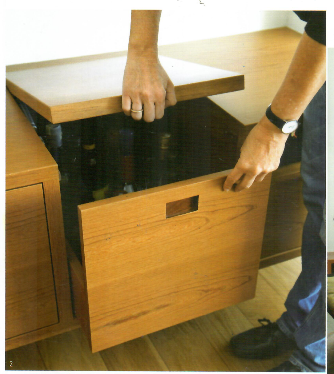
1,2. מראה כללי של הסלון. שולחנות הצד מותאֻמים לספה. ברקע, השולחן עם קערה מובנית ומזנון בו חבויה יחידת השמע ובר נשלף.

מערכת שמע של מכונית בחדר האמבטיה, תעלת חיווט הם רק חלק מה'פטנטים' שנמצאים בדירה בצפון תל–אביב