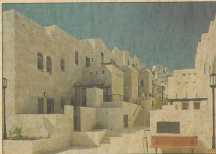
מתחם מנחת בירושלים, בתכנון גונגנהיים-בלוך, מתוך "Casas"